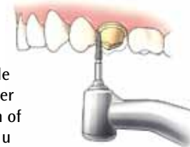
Afslipen van de tand of kies

Allereerst wordt een deel van de tand of kies afgeslepen, totdat er genoeg ruimte is om een kroon of brug te maken. Zo nodig krijgt u een plaatselijke verdoving.