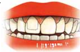
Een kroon over een voortand