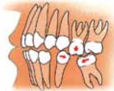
Zijaanzicht van een kaak: uitgroeien en scheef gaan staan van kiezen

Als tanden en kiezen ontbreken, kunnen de tanden of kiezen van de andere kaak in de richting van de open ruimte groeien. Ook kunnen de tanden of kiezen aan weerszijden van de open ruimte naar elkaar toe groeien, waardoor ze scheef gaan staan.