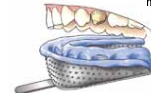
Afdrukkelpel met afdruk materiaal

Vervolgens maakt de tandarts een afdruk van uw hele kaak of het gedeelte waarin zich de afgeslepen kies bevindt. Hiervoor brengt de tandarts een afdrukkelpel met een rubberachtige massa in uw mond. Zo ontstaat een afdruk waarin later in een tandtechnisch laboratorium gips wordt gegoten. Op dit gipsmodel wordt de kroon of brug gemaakt.